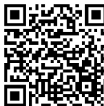
Wirtschaft heute derzeit vergriffen