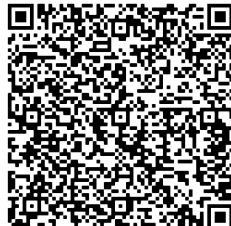
Wirtschaft heute im Moment vergriffen